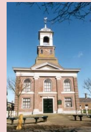
Waddenkerk De Cocksdorp