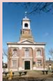
Waddenkerk De Cocksdorp