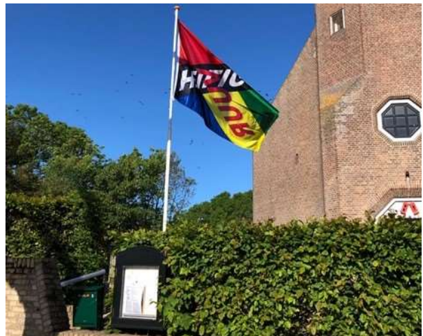
Heilig Vuur wapperde bij de Texelse kerken