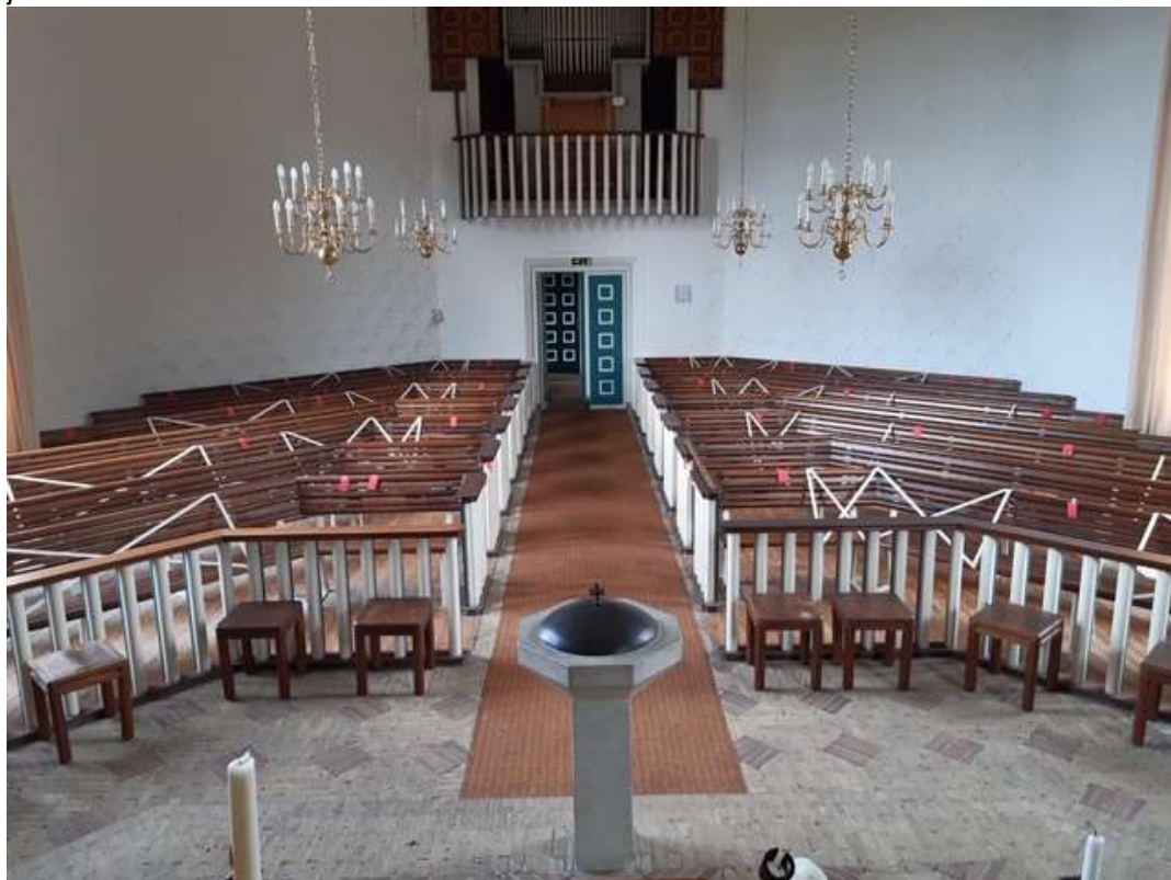
De kerk in De Waal klaar voor gebruik na 1 juli.