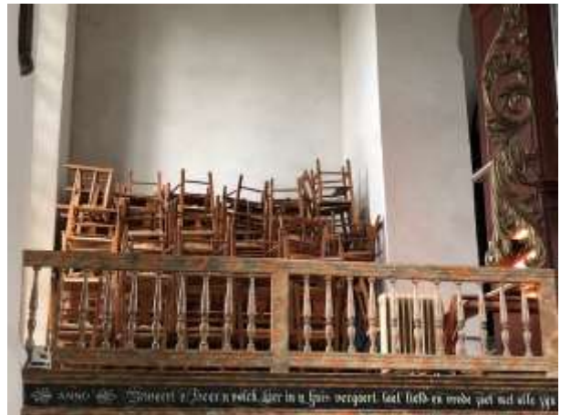
In Den Hoorn zijn de stoelen tijdelijk vervangen voor stoelen die beter schoon te maken zijn.