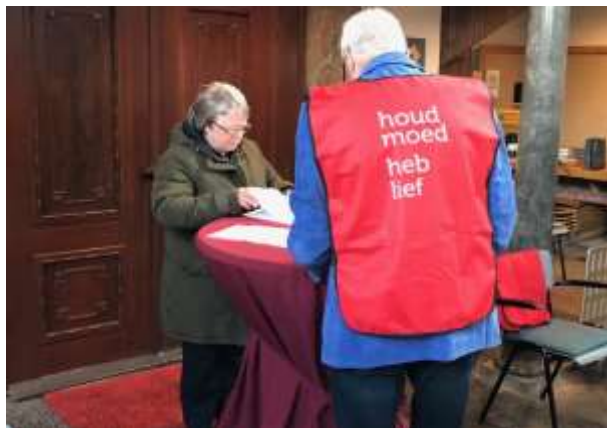
Twee impressies uit de kerkdiensten van de maand juni.