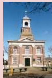
Waddenkerk De Cocksdorp