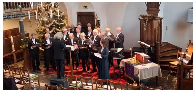
Vierde advent: optreden van het mannenkoor

In januari is het weer zover. Dan vragen wij U om uw jaarlijkse bijdrage aan onze kerk kenbaar te maken. Landelijk loopt deze actie van 10 tot 24 januari. Ongetwijfeld wordt u daar ook aan herinnerd via de pers. Wij zijn van plan de gebruikelijke informatie rond het weekend van 10 januari bij u in de brievenbus te doen. Wij hopen dat u vervolgens voor 1 februari de antwoordenvlop bij een van de kerkenraadsleden (of de Schuilhut in de Koog) in wilt leveren. Deze manier, dus niet meer aanbellen, is ons goed bevallen vorig jaar en we hebben ook positieve reacties teruggekregen. Uiteraard willen wij ook de antwoordenvlop bij u ophalen wanneer zelf brengen bezwaarlijk is. U kunt dan een van de kerkenraadsleden daarvoor vragen. Ondanks het dalende ledenaantal hopen wij dat ook dit jaar de opbrengst weer van vergelijkbaar niveau is als voorgaande jaren.