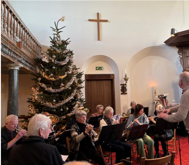
Eerste Kerstdag in de Hoornder kerk