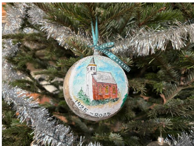
Eerste Kerstdag in de Hoornder kerk

De volgende kerkenraadsvergadering is op 7 januari.