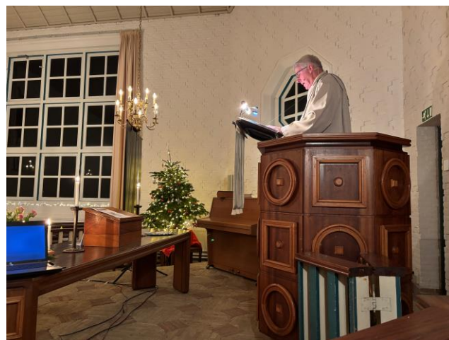
Kerstavond in De Waal