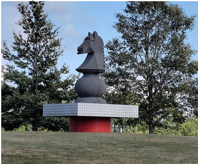
Schaakpaard op rotonde bij Alencon (Frankrijk)